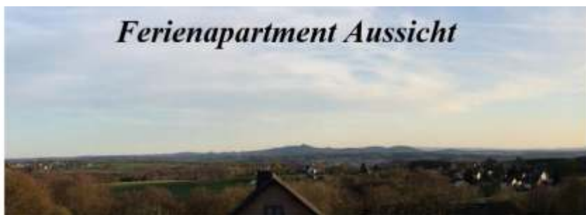
„Das kleine Apartment mit der tollen Aussicht“

... Natürlich auch allen Freunden, Eltern, Unterstützern! Ob es die Fahrbereitschaft, Kuchen- oder Salatspenden an den Spieltagen sind - es ist schön zu wissen, dass wir alle an einem Strang ziehen!