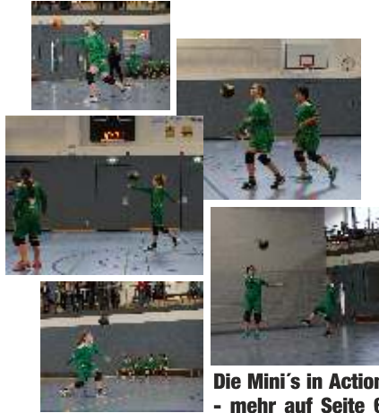
Die Mini's in Action - mehr auf Seite 6